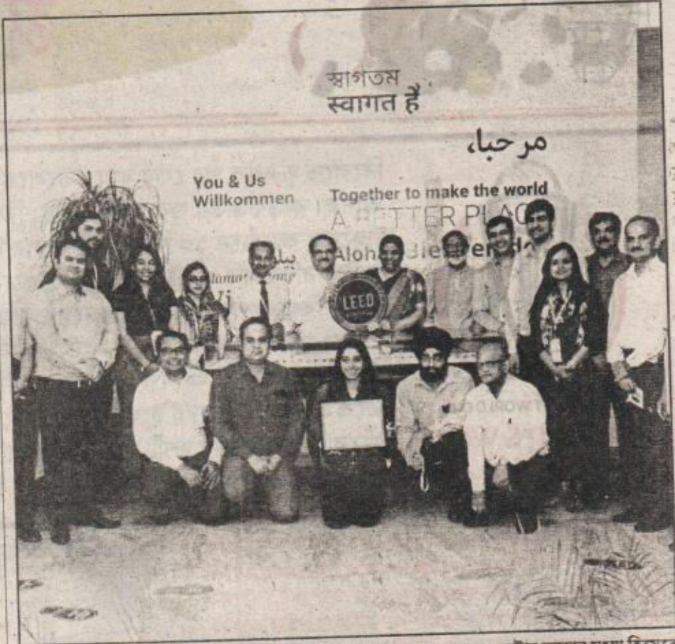
উন্নতির জন্য এলইইডি প্লাটিনাম পুরস্কারে ভূষিত হল গেনওয়েল কমনসেল। গ্রেটার নয়ডার সংস্থা হিসেবে বিভিন্ন বিষয়ে উন্নতির জন্য এই পুরস্কার পেয়েছে।